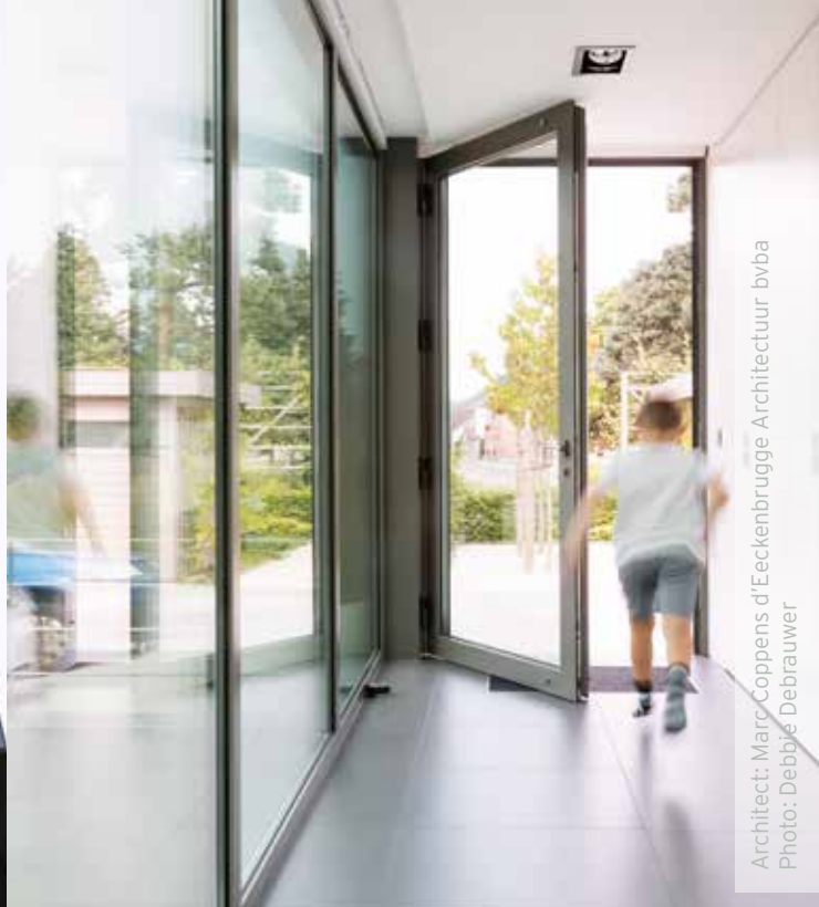
Architect: Marc Coppens d'Eeckenbrugge Architectuur bvba