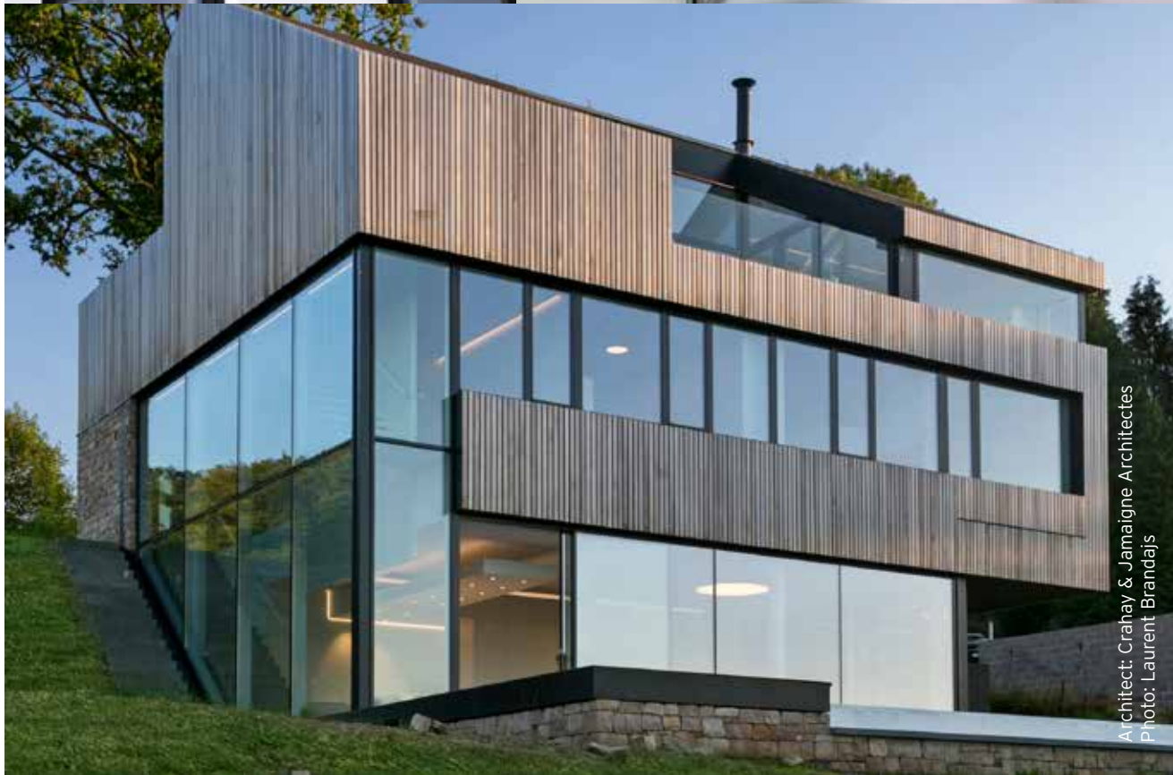
Architect: Crahay & Jamaigne Architectes