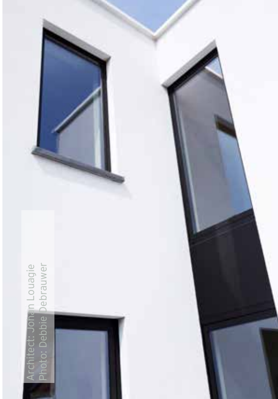
Architect: Johan Louagie